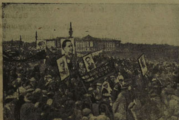
1 мая в Ленинграде. Колонны демонстрантов.