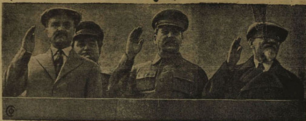
Первомайский парад на Красной площади. НА СНИМКЕ: Т. Т. СТАЛИН, МОЛОТОВ, КАЛИНИН И ДИМИТРОВ на трибуне.