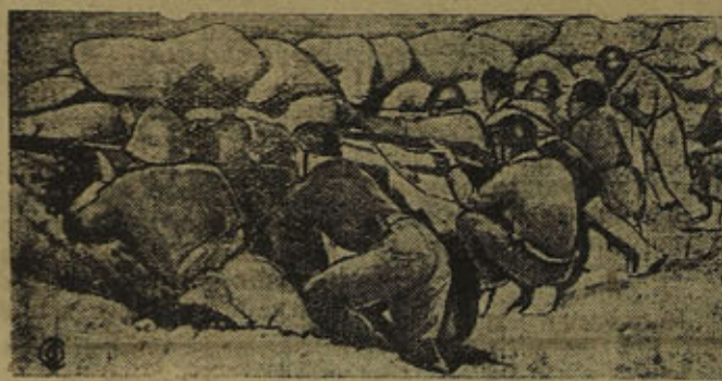
К военно-фашистскому мятежу в Испании. На СНИМКЕ: отряд рабочей милиции на передовых позициях Арагонского фронта.

ОДЕССА 11 (ТАСС). Сегодня снова мощные колонны трудящихся собрались у причала, где стоит теплоход „Нева“, подготовленный для очередного рейса в Испанию. Совместно со стахановцами одесских предприятий и транспорта работниками науки и искусства в порт явились лучшие люди Киева, Харькова, Полтавы, Кременчуга, Николаева. Они приехали в Одессу выполнить поручения трудящихся своих городов — проводить теплоход в дальнейший рейс. На „Неву“ погружено