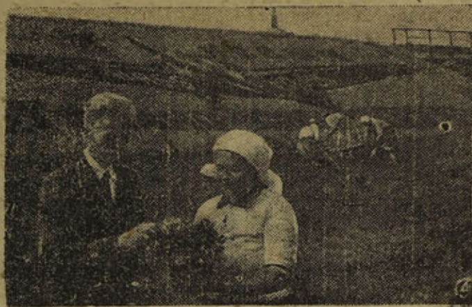
На озеленение Магнитогорска в текущем году ассигновано 750 тыс. рублей. В течение весны и лета посажено цветов-летников 490 кв. метров, ковровых цветов — 1583 кв. метра, газонов — около 60 тыс. кв. метров, высажено в грунт более 450 деревьев, кроме того более 6 с половиной тыс. штук кустарниковых черенков. Так степной город постепенно становится зеленым.