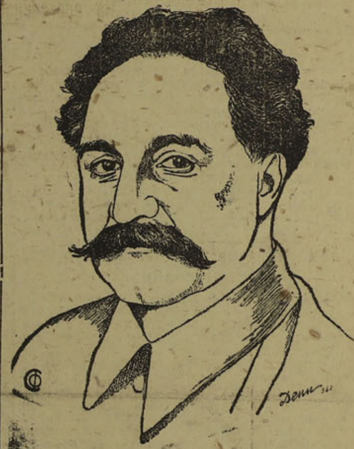
Портрет тов. Г. К. Орджоникидзе.