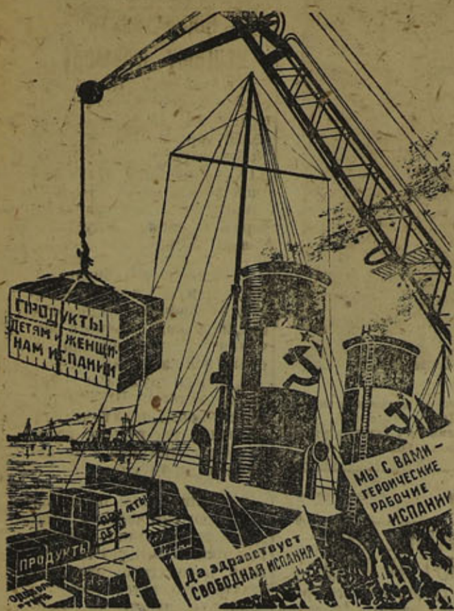
Груз, направляющийся в Испанию из СССР. (Рис. худ. Дени и Долгорунова).

Для культурного обслуживания населения и лесозаготовок необходимо обеспечить регулярный проезд кинопередвижки. А. И.