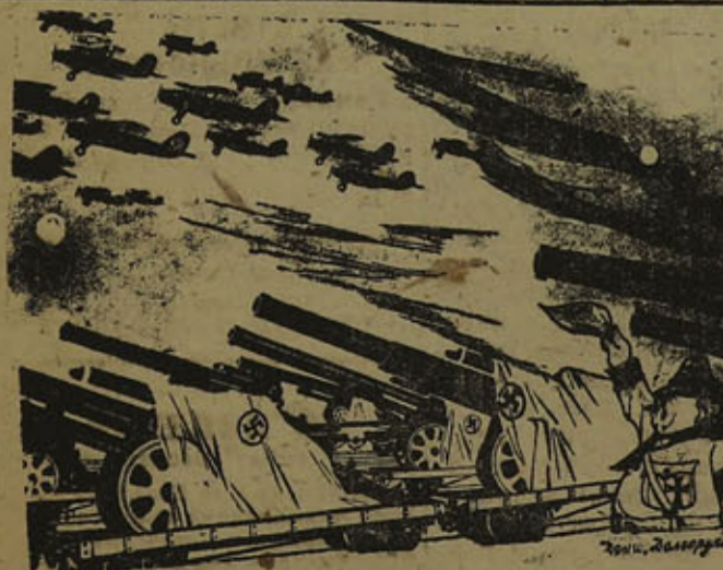
Груз, направляющийся в Испанию из Германии, Италии и Португалии. (Рис. худ. Дени и Долгорунова).

Испанское военное министерство издало приказ, обязывающий всех дружинников милиции, находящихся в Мадриде, явиться немедленно в свои части. На фронт спешно перебрасываются подкрепления. Остающиеся в городе отряды милиции находятся наготове в казармах.