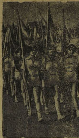
Областная колхозная спартакиада в Днепропетровске. На снимке: физкультурники — участники колхозной спартакиады на параде.