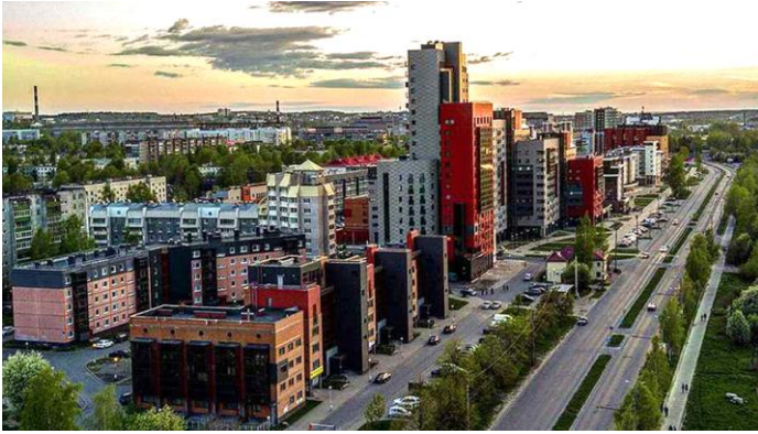
Жилой комплекс Созвездие на Варкауса