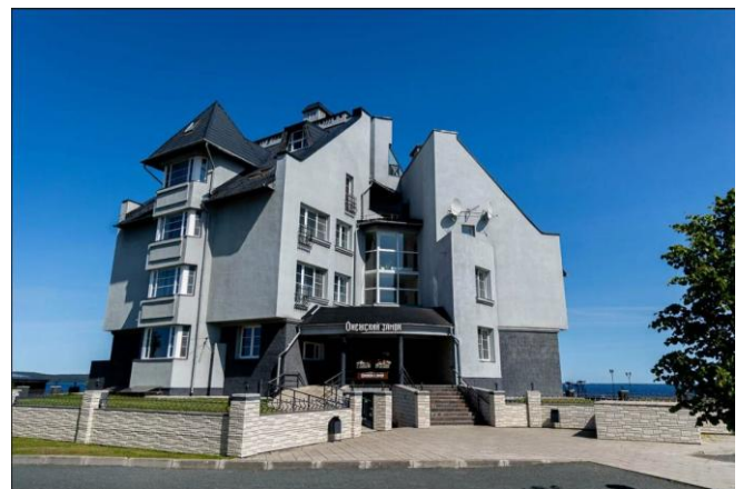
Гостиница «Онежский замок»