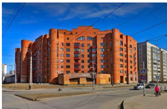
Дом на ул. Чапаева, 45. 2023 г.

В 1987-2007 гг. работал в проектном институте «Карелгражданпроект» архитектором, руководителем группы, главным архитектором проектов; в 2007-2014 – архитектором в ЗАО ТАПМ «Петрозаводскархпроект»; с 2017 занимается частной архитектурной практикой.