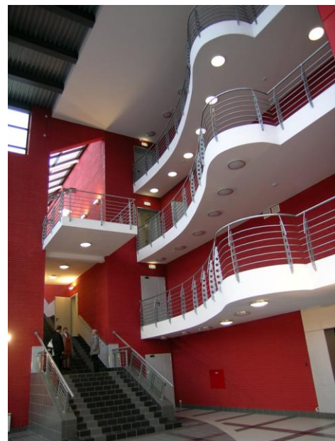
Административное здание железной дороги. Шотмана, 23. Интерьер