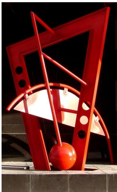
Декоративный элемент дома на ул. Свердлова, 15

для функции, отличающейся от народного училища (затем – женской гимназии), построенного в 1789 году. Архитектор Фролов запроектировал пристройку во двор и устроил третий этаж,