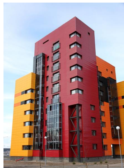
Жилой дом на Варкауса, 33. Фрагмент фасада