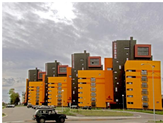
Жилой дом на Варкауса, 33

- 14-кв. жилой дом с 9-кв. пристройкой, ул. Варламова, 13 (2002);