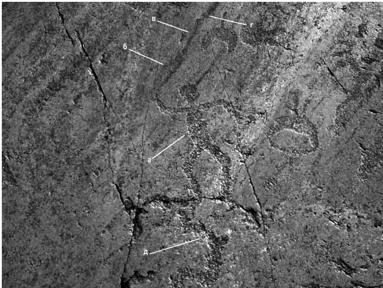
Фото 1. Петроглиф на мысе Пери Нос VI, изображающий бой Индры с Вритрой

дубины Индры с востока на запад и форму траектории, которая похожа на пологую параболу. Нужно обратить внимание на то, что Индра ещё не ударил лежащего внизу Вритру, а только замахнулся, на основании чего можно предположить, что удар был нанесён не на территории мыса Пери Нос, а дальше на запад. При построении возможной траектории, изображённой на петроглифе в виде шлейфа за дубиной, получилось, что реальная траектория полёта ваджры-болида могла проходить через южную часть Онежского озера в направлении на жёлоб, по которому, по данным геологии, произошёл прорыв Балтийского ледникового озера с последующим образованием Йольдиева моря, что, возможно, случилось до 8300 года до нашей эры [17, с. 11]. Эти события, вероятно, отражены в тексте Ригvedы [1, Мандала I, 32]: