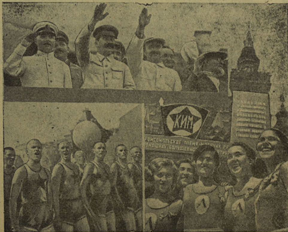
На снимке: Вверху — с трибуны приветствуют проходящие колонны т.т. Сталин, Молотов, Ворошилов, Каганович, Калинин, Димитров и др. Внизу — прохождение колонн физкультурников.

30 июня в Москве на Красной площади состоялся парад физкультурников, в котором приняло участие около 115 тыс. человек. После торжественного марша физкультурников состоялись грандиозные спортивные - гимнастические выступления, различные упражнения исполнили пионеры, гимнастическая группа профсоюзов, студенты Московского и Ленинградского институтов физической культуры, слушатели курсов колхозников-физкультурников Московской обл. и др. Парад показал высокое качество физического воспитания трудящихся, явился грандиозной демонстрацией мощи страны Советов.