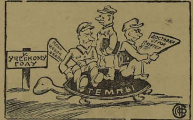
Иллюстрация к строительству Кодозерской школы