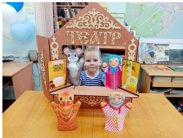
Литературно-театрализованный час «И...оживают куклы» к Международному дню театра кукол. 2024г.

Ежегодно библиотека активно участвует в общероссийских и общесистемных мероприятиях МУ «Петрозаводская ЦБС»: акциях «Дарите книги с любовью», «Город читает детям», «Читаем детям о войне» и «Благотворительный школьный базар»; в мероприятиях Недели детской книги; в программе Летних чтений. Читатели Соломенской библиотеки часто становятся призёрами и лауреатами различных конкурсов.