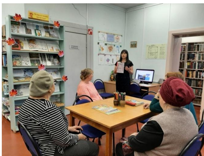
Информационный обзор «Рекомендуем почитать!», 2023г.

Для читателей и жителей района Соломенное библиотека проводит информационно-просветительские и культурно-досуговые мероприятия разных форм и тематики по различным направлениям деятельности: литературное и историческое краеведение, патриотическое воспитание, гражданское просвещение и социально значимые мероприятия.