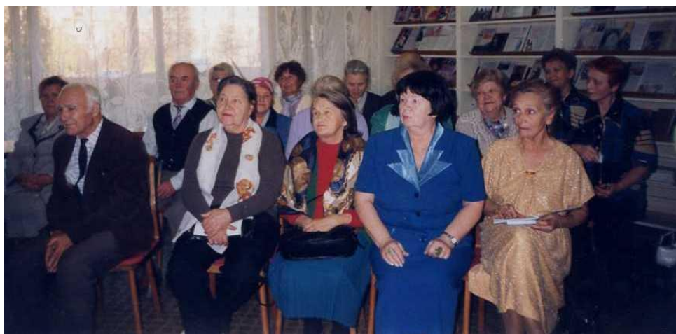
На одной из первых встреч в клубе, 1997 г.

Расшифровка аббревиатуры «ЛИК» даёт представление о содержании работы клуба: «Литература. Искусство. Культура». Можно сказать, что при библиотеке были открыты «Литературная» и «Музыкальная» гостиные. Девиз клуба: «Жизнь коротка, искусство долговечно».