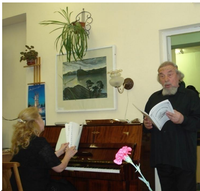
Народный артист Карелии, певец В. С. Каликин, 1997 г.

Свои произведения представляли карельские композиторы Александр Белобородов, Эдуард Патлаенко, Роман Зелинский, Альбин Репников, Владимир Угрюмов.