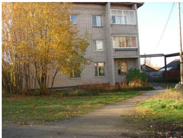
Жилое здание на ул.Соломенская,д.25, в котором располагается библиотека

Отдел обслуживания «Библиотека №4» МУ «Петрозаводская ЦБС» (Соломенская библиотека) – учреждение культуры района Соломенное, расположенное по адресу: Соломенская ул., д.25. Библиотека находится в жилом трёхэтажном здании на первом этаже. В структуру учреждения входят: абонемент для детей и взрослых читателей, а также лекционный зал. Площадь библиотеки – 104,8 кв.м.