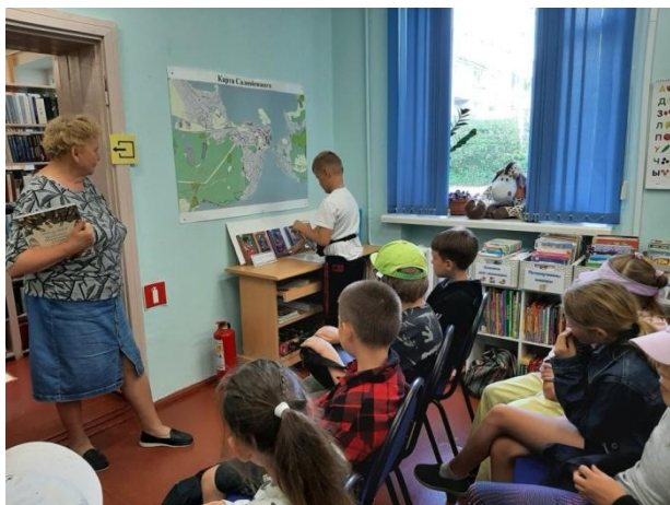
Игра-викторина по книге А. Волкова «Волшебник Изумрудного города» ( в рамках Летних чтений), 2024г.

Для детей и молодежи просветительские мероприятия проходят в формате диалогов, познавательно-исторических часов, громких чтений, творческих встреч с карельскими писателями и поэтами, информационных, литературных, краеведческих часов. В работе как с детьми, так и со взрослыми постоянно используются интерактивные формы: настольные игры, литературно-краеведческие игры, викторины, кроссворды, загадки. Для читателей всех возрастов библиотека ежегодно проводит обзоры книг и периодических изданий, Дни новой книги, библиотечно-библиографические занятия, экскурсии по направлению «Информационная культура личности».