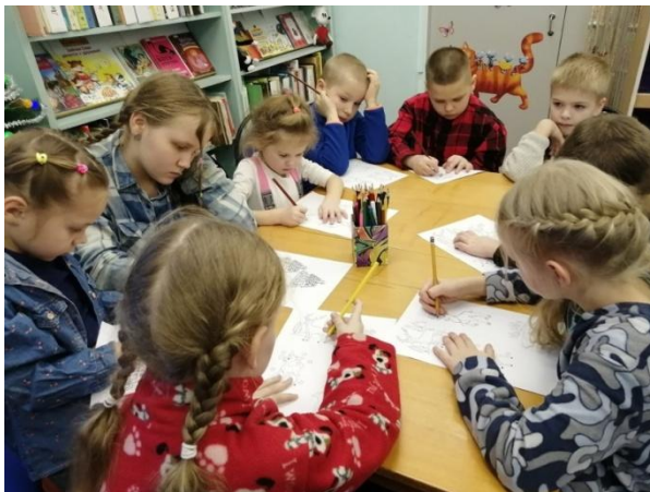
Детский уголок – место для чтения и занятий творчеством

книжки-раскраски, мягкие игрушки, красочные детские книжки. Здесь дети читают, играют в настольные игры, рисуют, мастерят.