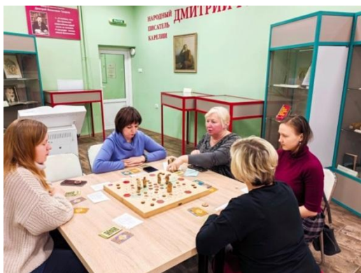
Члены клуба «КнигоЧай» играют в настольную игру «Поход за Сампо»

В Центральной городской библиотеке им. Д. Я. Гусарова есть два клуба, заседания которых проходят ежемесячно! «КнигоЧай» – для любителей обсуждения книг разных, даже самых неожиданных жанров за чашечкой вкусного напитка, и «Душегрейка» – для тех, кто постарше – здесь вас ждут литературные и музыкальные вечера, а также тематические поездки по нашей республике.