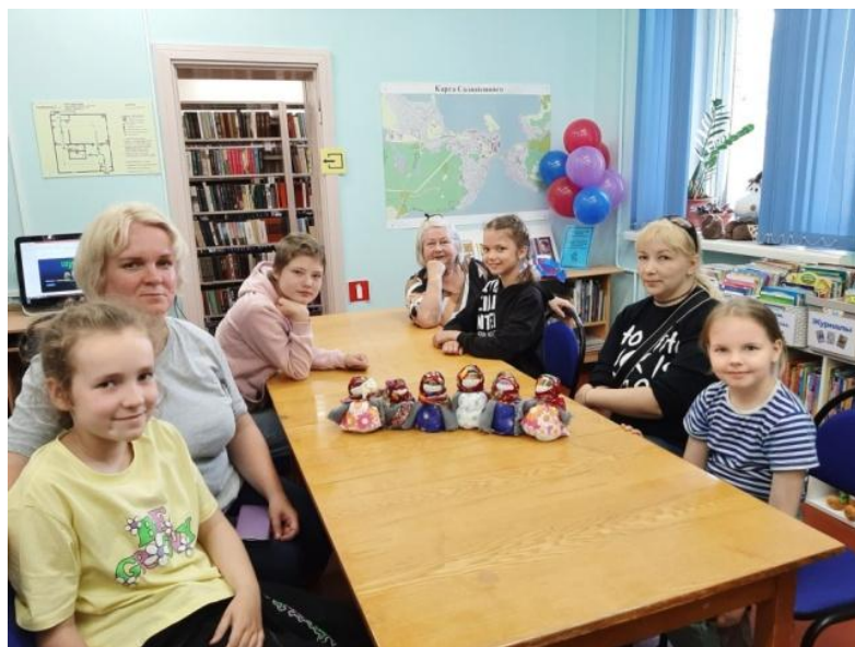
Участники мастер-классов из цикла «Обрядовые куклы в народном календаре»

В наше непростое время детское чтение нуждается в поддержке, поэтому Соломенская библиотека уделяет большое внимание работе с семьей. Потому что именно родители выбирают ребенку его первые книжки, рассматривают вместе с ним картинки, переживают с ним радость узнавания и удивления, связанные с приключениями и судьбами первых литературных героев.