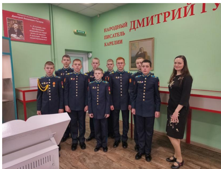
Экскурсия по музейной комнате для активистов Школы «Юный патриот» - кадетов Петрозаводского Президентского кадетского училища, 20 октября 2024 г.

В рамках проекта по созданию музейной комнаты сотрудниками библиотеки была подготовлена видео экскурсия, благодаря которой удаленные пользователи могут познакомиться с экспозицией музейной комнаты.