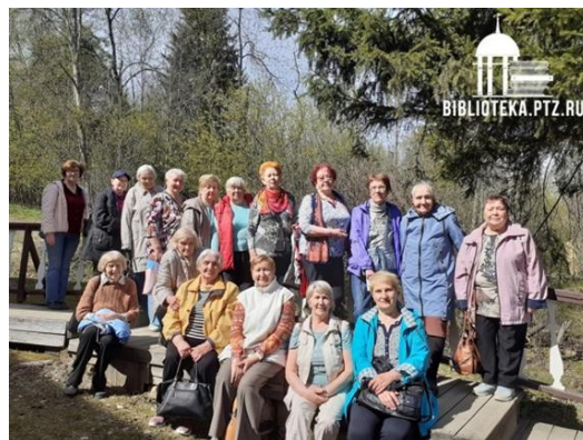
Члены клуба «Душегрейка» на выезде в Марциальные воды

Приходите к нам, чтобы убедиться в том, что современная библиотека – это настоящий информационный и досуговый центр, где работают молодые душой и телом специалисты, а ДНК на самом деле расшифровывается как День Новой Книги!