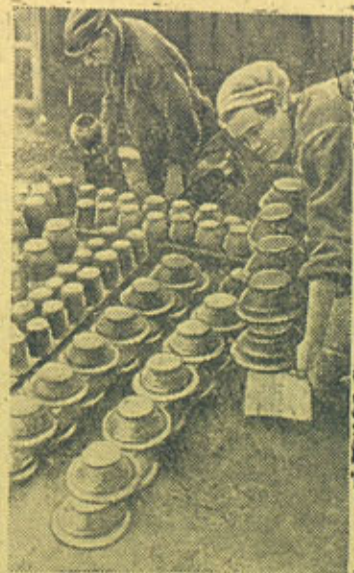
На снимке: сортировка готовой продукции.

На освобожденной земле. Калужская скульптурная фабрика открыла цех по изготовлению глиняной посуды.