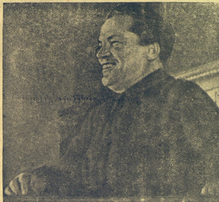
Сегодня, 26 марта, исполнилось 55 лет со дня рождения пламенного трибуна революции Сергея Мироновича Кирова.