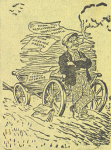
...а воз и ныне там!...