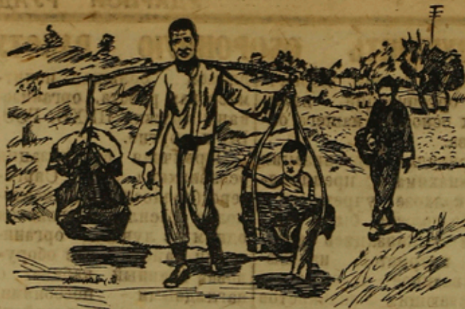
К военным действиям в Китае. На сн.: китайский крестьянин с женой и раненым ребенком спасаются из района, занятого японскими интервентами.

Выступающей сўвэсти критикуйдох райпотреб-союзу пахаста руавоста и аиветых предложенийя руавон парандамизех.