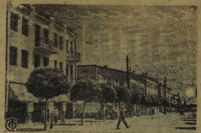
На снимке: Кабардинская улица в г. Нальчике, столице орденоносной Кабардино, Болкарии.

Фашизм пытается доказать, что он „ликвидировал классы“. Фашистское правительство объявило что отныне все земледельцы образуют единое „сословие народного питания“, все члены которого „равноправны“. В это „сословие“ входят и помещик, и батрак, и даже промышленник и купец перерабатывающий или продающий сельскохозяйственную продукцию. На деле в „сословии“ никакого равноправия нет, в нем заправляют помещики, фабриканты и кулаки,