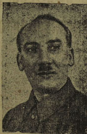
Генрих Григорьевич Ягода Народный Комиссар Связи Союза ССР.