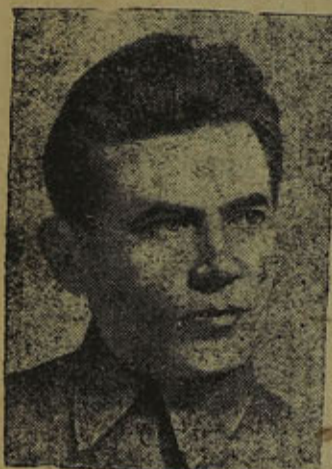
Николай Иванович Ежов Народный Комиссар Внутренних Дел Союза ССР.

От парка культуры и отдыха таймуны на автомобилях проехали на Краевую площадь, к мавзолею Ленина.