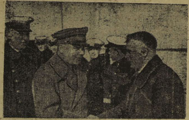
Тов. К. Е. ВОРОШИЛОВ на тактических учениях Краснознаменного Балтийского флота

29-го сентября прибыл в Кронштадт для участия в осенних тактических учениях Краснознаменного Балтийского флота Нарком Обороны, маршал Советского Союза К. Е. ВОРОШИЛОВ .