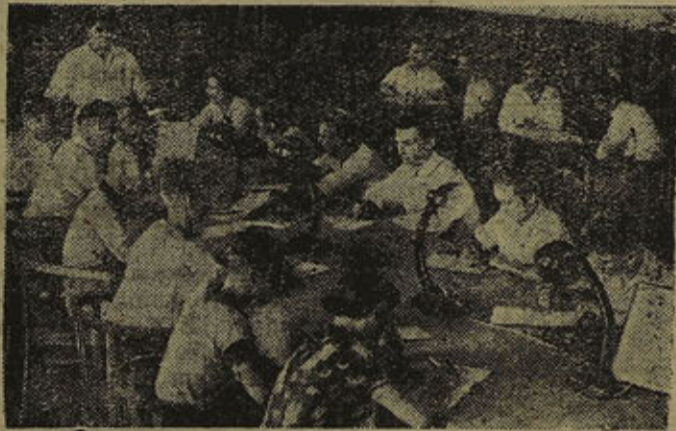
Дом партийной учебы им. Кирова в Одессе.

В доме работает 11 кабинетов по повышению политического уровня партактива. Дом прекрасно отделан, в кабинетах подобраны необходимые пособия. Для отдыха имеется красивое фойе и зимний сад.